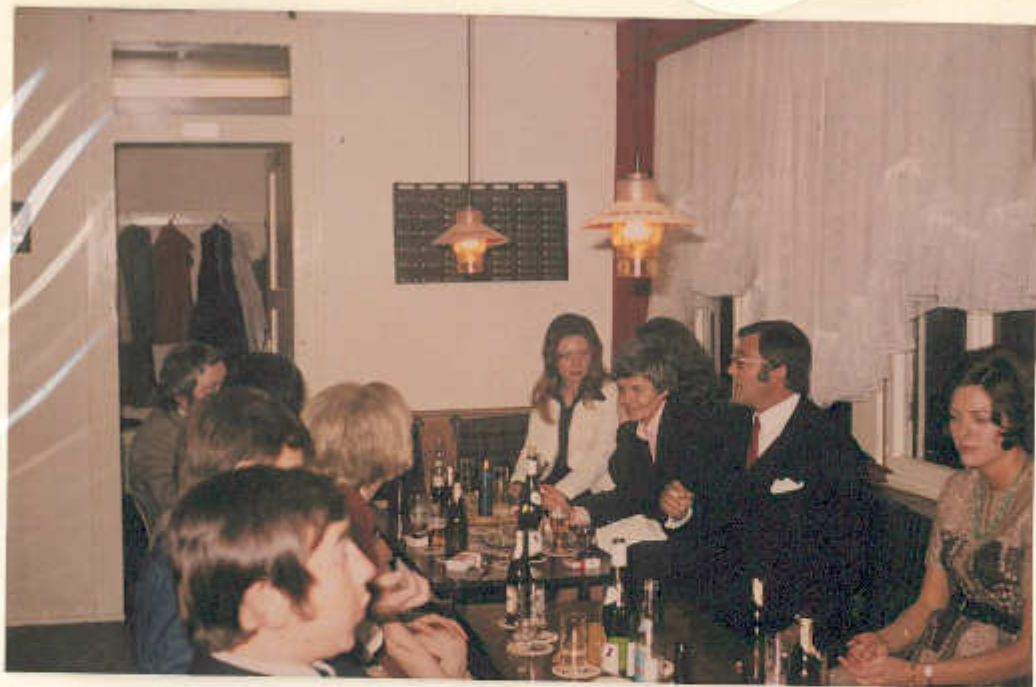
Feier im Clubhaus