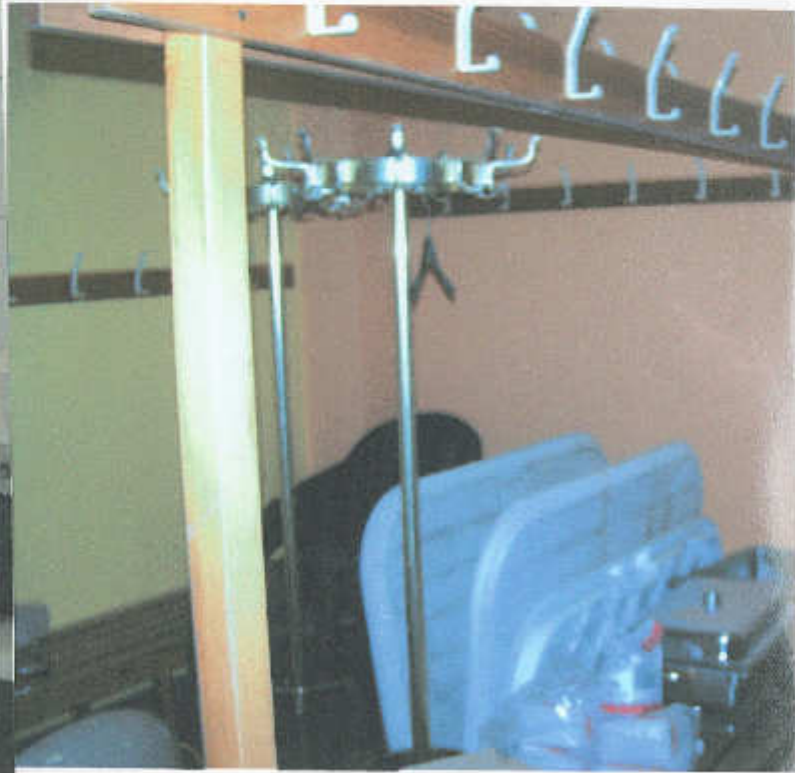
Beim Umbau der Kabinen