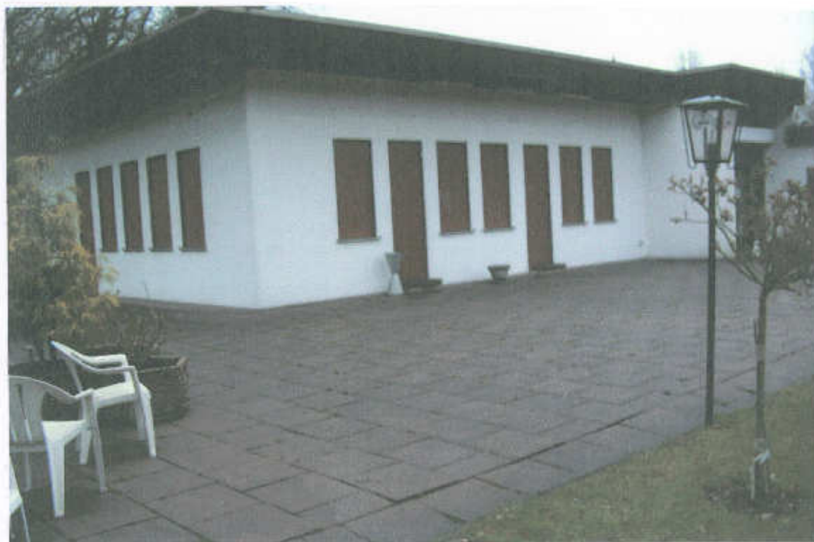
Clubhaus Februar 2007